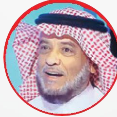
رئيس المجلس د/ إبراهيم بن أحمد بن سليمان الضبيبي